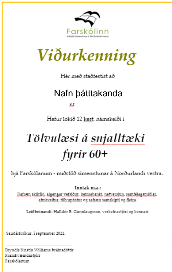
Mynd 3. Sýnishorn af viðurkenningarskjali.