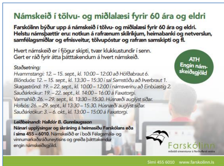
Mynd 1. Dæmi af auglýsingu Farskólans.

Námskeiðin voru tímasett og auglýst í svokölluðum sjónvarpsvísimum; „Sjónaukanum“ sem borinn er í öll hús í Húnaþingi vestra og í „Sjónhorninu“ sem borið er í öll hús í A – Húnavatnssýslu og í Skagafirði. Sjá mynd 1.